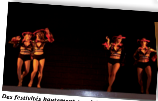
Des festivités hautement conviviales ! C'est dans la salle Henri Boissière que les familles membres du comité de jumelage se sont réunies le samedi soir, en compagnie de quelques invités. Particulièrement festive, la soirée a débuté en gourmandises avec un dîner-spectacle suivi d'une soirée dansante des plus rythmées !