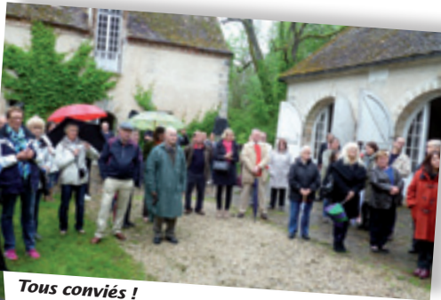
Tous conviés ! Samedi 10 mai à 11h30 : accueil des familles membres du comité de jumelage et de l'ensemble des Grandvertois conviés au vin d'honneur offert par la commune dans le parc du château.