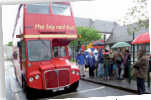
Des animations hautes en couleurs ! Le parc du domaine de la Saussaye accueillait une exposition de véhicules de prestige anglais dans ses jardins. Les convives ont eu le loisir d'admirer quatre magnifiques Rolls Royce tout au long de la journée du samedi. Les plus audacieux ont quant à eux fait le tour du village en bus à impériale rouge vif ! So British !