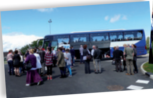
Retrouvailles ! Vendredi 9 mai en soirée : arrivée des familles anglaises à Vert-le-Grand.