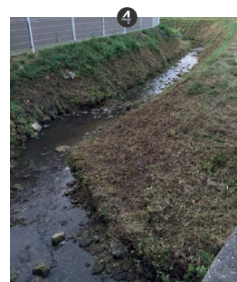
2 La récolte Yannick Farrant, responsable des espaces verts communaux, devant le tas de branchages récupérés. Impressionnant !