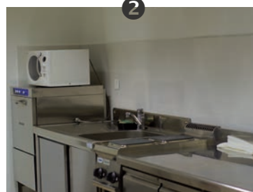
1 Un lieu historique réhabilité

Dans ce grand projet, une attention toute particulière a été portée aux couleurs, peintures, finitions... Avec la volonté d'offrir aux associations et aux Grandvertois des espaces accueillants et fonctionnels.