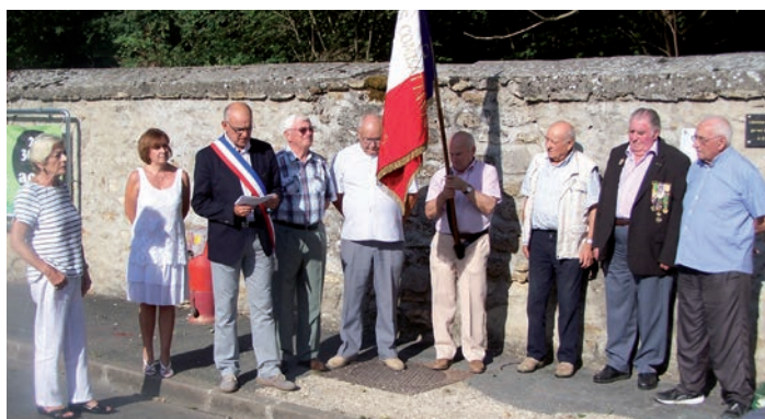
Cérémonie de commémoration de la libération du village à la plaque de la Fontaine de Berthault.

Durant la fête du village, 37 jeunes ont vendu 300 brioches pour récolter de l'argent en vue d'une sortie au Parc Asterix.