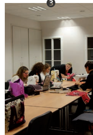
3 Atelier couture dans une ambiance conviviale