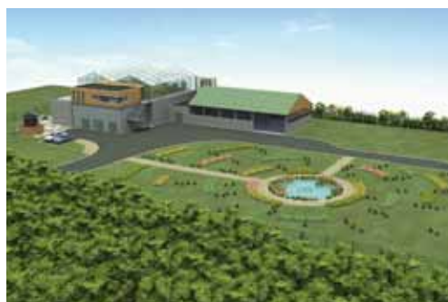
La future station d'épuration évoquée par le maire

les gens du voyage à Mennecy, l'aménagement des équipements sportifs de la commune de Champcueil ou encore le franc succès remporté cette année encore par le Tour du Val d'Essonne. Un véritable défi logistique qui a été relevé haut la main par la commune de Vert-le-Grand, qui hébergeait le départ et l'arrivée de la compétition. Des projets réussis et dont les bénéfices sont d'ores et déjà éprouvés par leurs usagers.