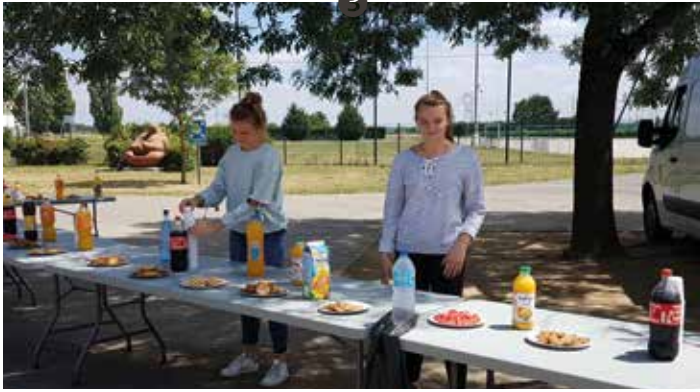
③ Remise des prix aux écoles, 23 juin 2017.